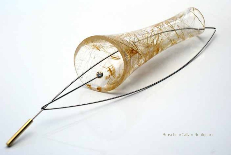
Brosche »Calla« Rutilquarz